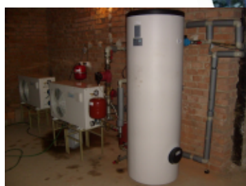
Instalace tepelných čerpadel celkem: 110 315 Kč