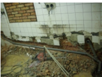
Rekonstrukce kuchyně celkem: 86 810 Kč