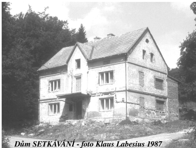
Dům SETKÁVÁNÍ 1987