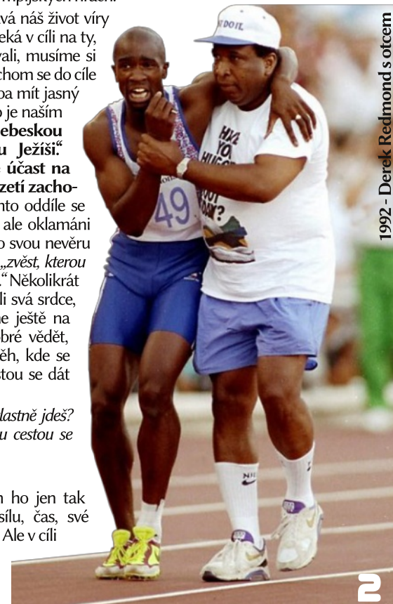
1992 - Derek Redmond s otcem

Život je příliš cenný na to, abychom ho jen tak promrhali. Do čeho investujeme svou sílu, čas, své schopnosti? Život tady na zemi je dočasný. Ale v cíli nás čeká věčnost. Nebylo by tedy moudřejší investovat více času do čtení nepomíjitelého Božího Slova než