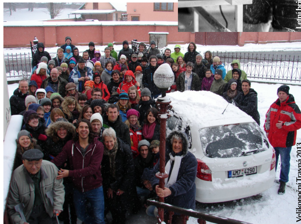
Velikonoční Travná 2013