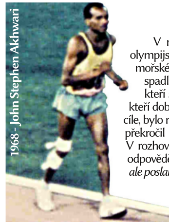
1968 - John Stephen Akhwari

Dať do toho všechno a navzdory pádu vstal, aby s obrovskou bolestí splnil svůj úkol. Vždyť kvůli tomu tolik trénoval, na to se připravoval tak dlouho, aby mohl reprezentovat svou zemi na olympijských hrách.