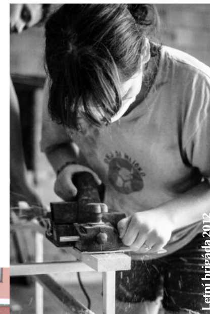
Letní brigáda 2012